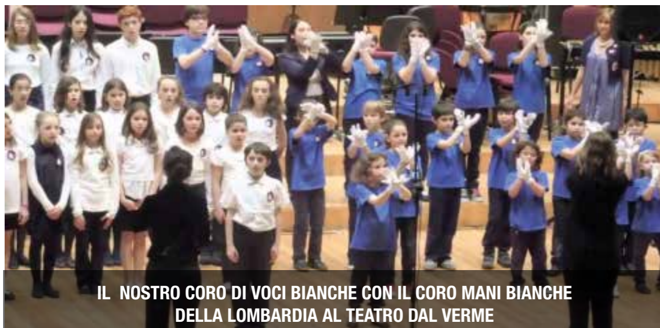
IL NOSTRO CORO DI VOCI BIANCHE CON IL CORO MANI BIANCHE DELLA LOMBARDIA AL TEATRO DAL VERME